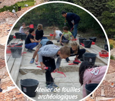
Atelier de fouilles archéologiques

DES PARCOURS « COLLÈGE ET PATRIMOINE » PROPOSÉS PAR LE DÉPARTEMENT DE L'HÉRAULT