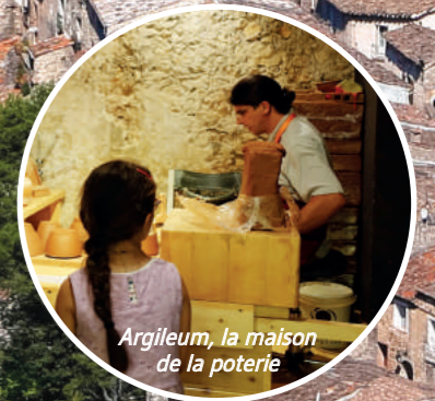
Argileum, la maison de la poterie