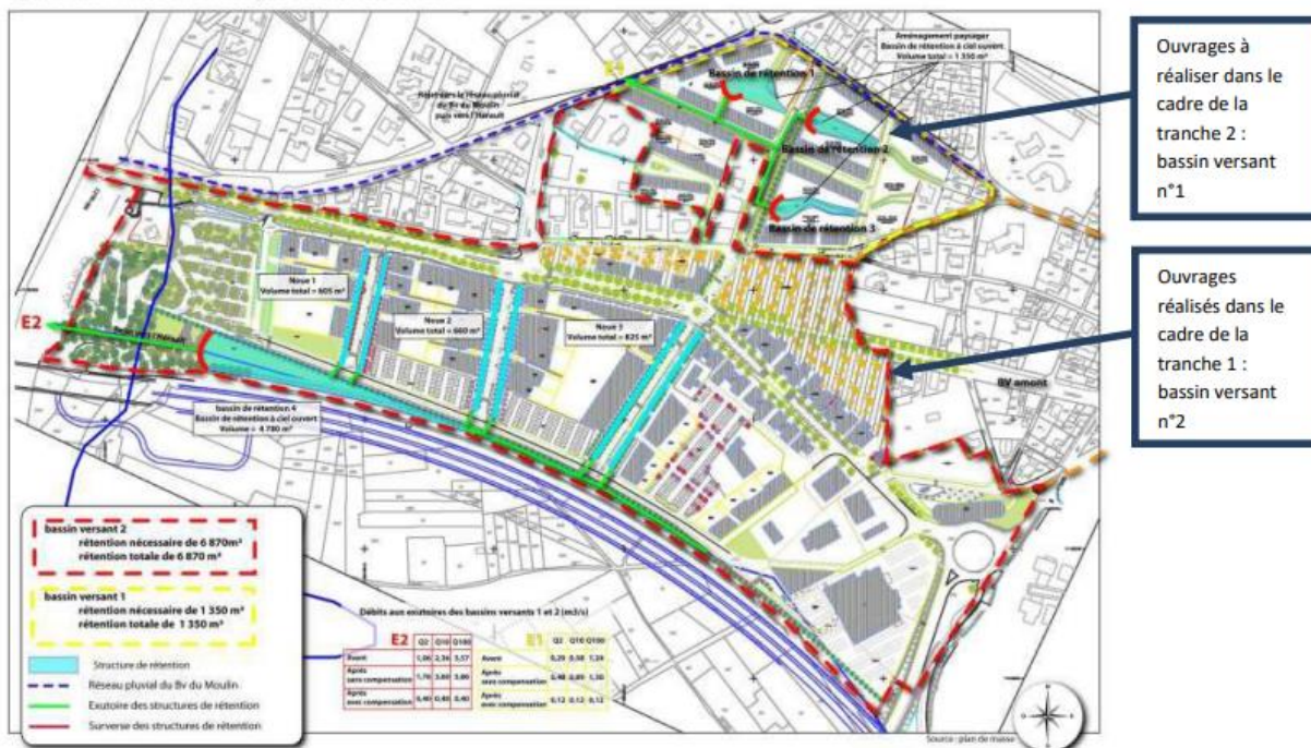
SCHEMA DE PRINCIPE HYDRAULIQUE - CREATION DE LA ZAC